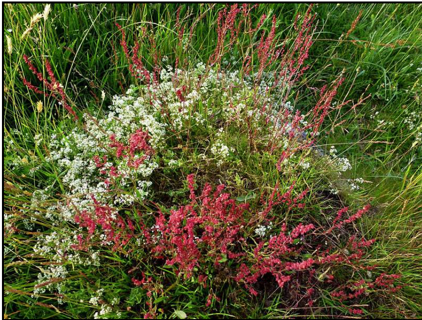
Stenmåra och bergsyra