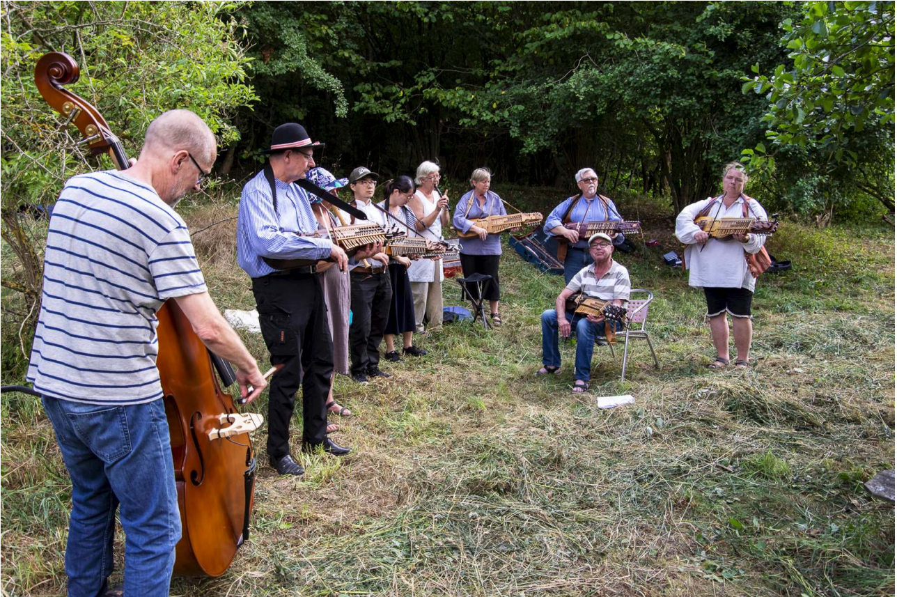
"Harpolirarna underhåller" från slåtterfesten 2018