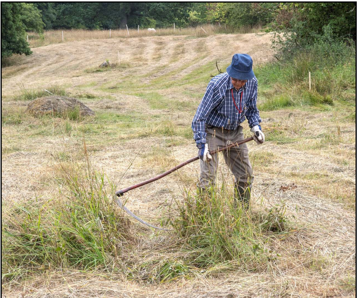
Slätter på Kastberga äng